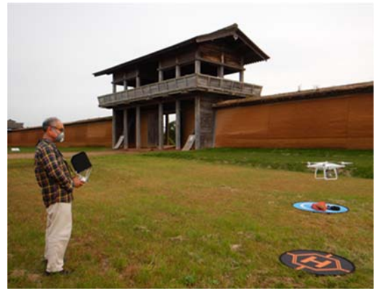
図8 HPよりドローン発進 (Phantom4ProPlusV2.0)