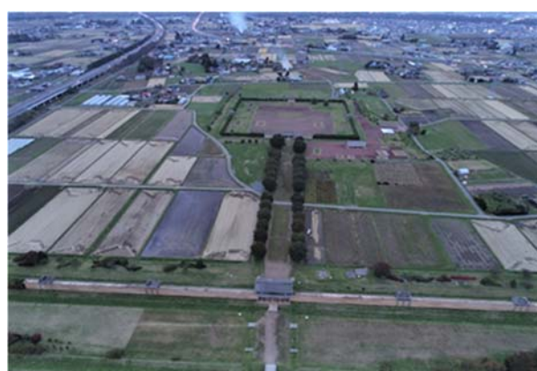
図1 志波城(中央少し上が政庁跡) (ドローン空中撮影)

このように東北地方の城柵は, 防禦機能を備えた施設であり, 本研究グループが進めている日本列島各地に通時的に広がる防禦機能を持つ大規模遺跡の比較研究の中で, 重要な研究対象の一つとなる。本研究グループが主たる研究対象とする西日本の古代山城