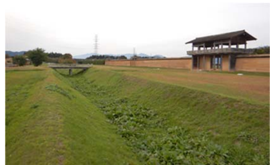
図6 外大濠と外郭南門

れた低位段丘上にあり, 周囲とほとんど高さが変わらない平地である(図 1~3)。この地に残る小字名「方八丁」は江戸時代の絵図にも記されており 7) , その四角い形の区画は, 発掘が開始された 1976 年当時(この当時は「太田方八丁遺跡」と呼称されていた)にはよく残されていた(図 2)。