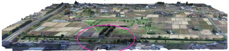
図13 3次元モデル4(領域モード+一部建物モード)

ている。3次元モデルも、それぞれ1枚の板のように見え、防禦機能が低いことは明白である。領域モードのみの写真測量画像を使った3次元モデル(図9・10)も、これに外郭南門部分のみ建物モードで撮影した写真測量画像を加えて作った3次元モデルも、平らな場所については出来栄にそれほど差はない。