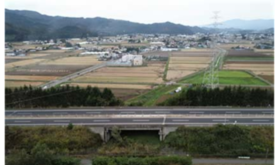
図9 東北自動車道と鉄塔、送電線 (ドローン空中撮影)

写真測量画像の撮影には最適の天候となった。使用したドローンは、DJI 社の Phantom4ProPlusV2.0 である。