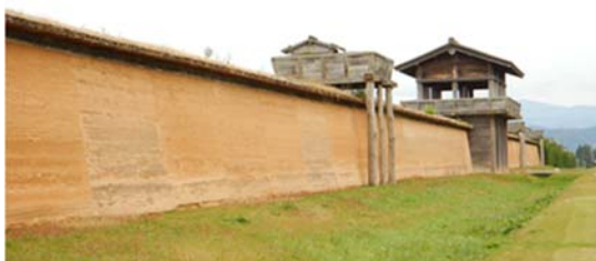
図4 外郭築地大垣 (中央に櫓, その右に外郭南門が見える)