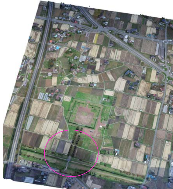
図12 3次元モデル3(領域モード+一部建物モード)