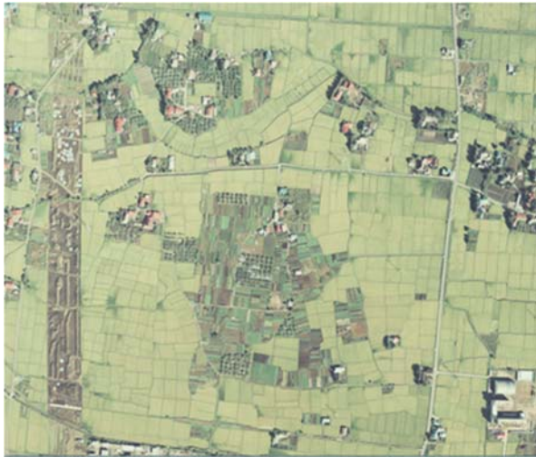
図2 発掘が始まった当初の志波城跡一帯 [1976年9月30日, 空中写真 (CT0766-C8-27) ]