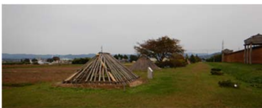
図3 平坦な城内, 竪穴住居跡

造営された場所は、岩手県盛岡市の中心部から 5 km ほど西、北上川に合流する手前の雫石川右岸に形成さ